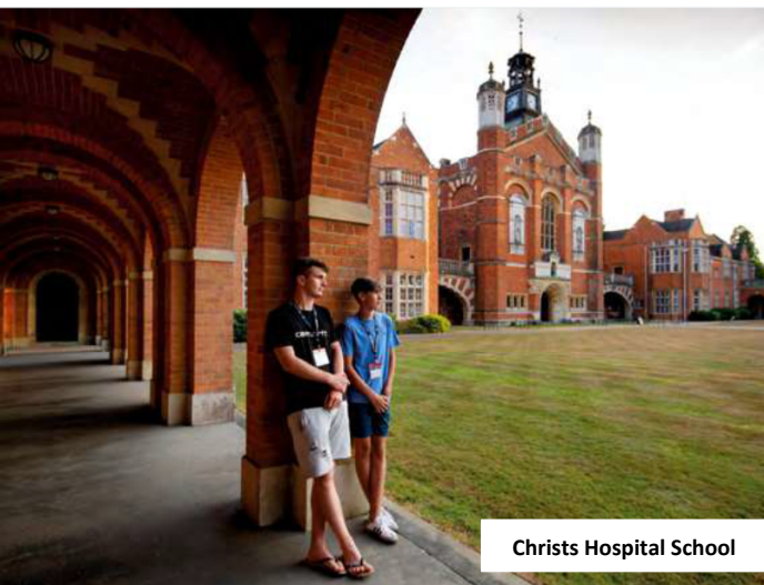
Christ's Hospital School